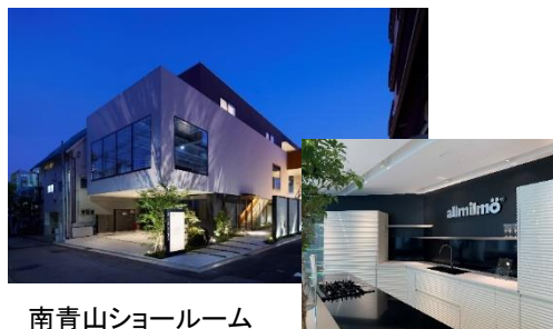
南青山ショールーム