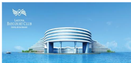
LAGUNA BAYCOURT CLUB HOTEL&(蒲郡)