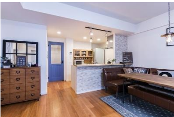
マンションリフォーム