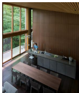
Kiyosato Yamanashi Combination of concrete and veneer