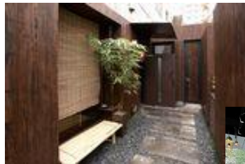
店舗等リノベーション