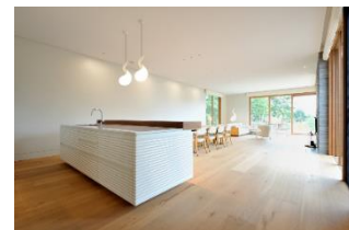
Karuizawa Nagano Contura HGL